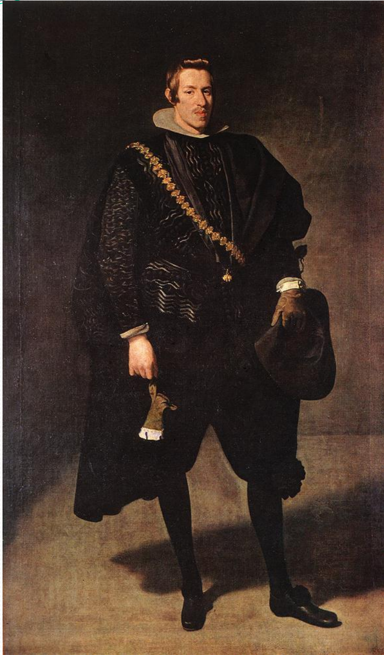
EL INFANTE DON CARLOS