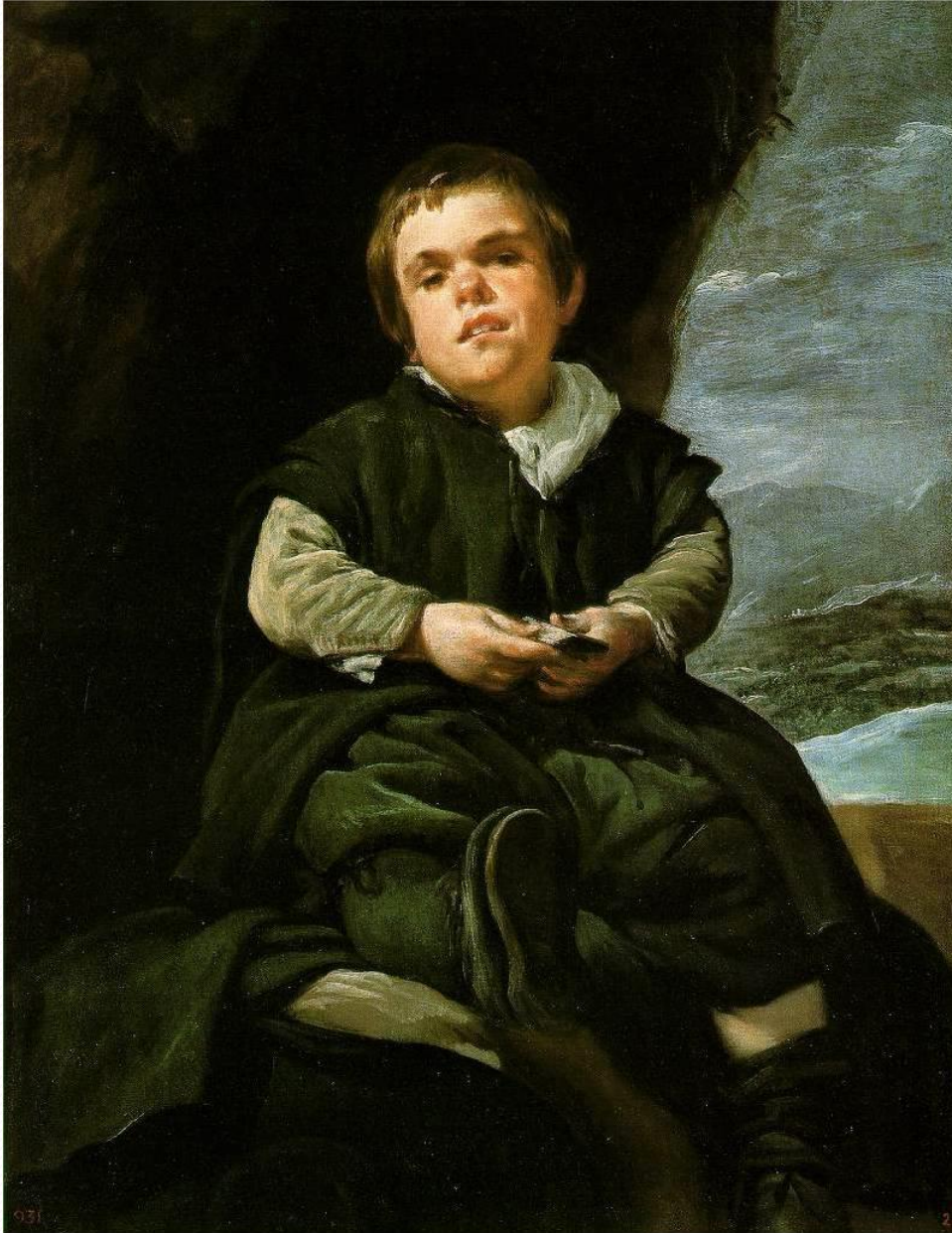
EL NIÑO DE VALLECAS