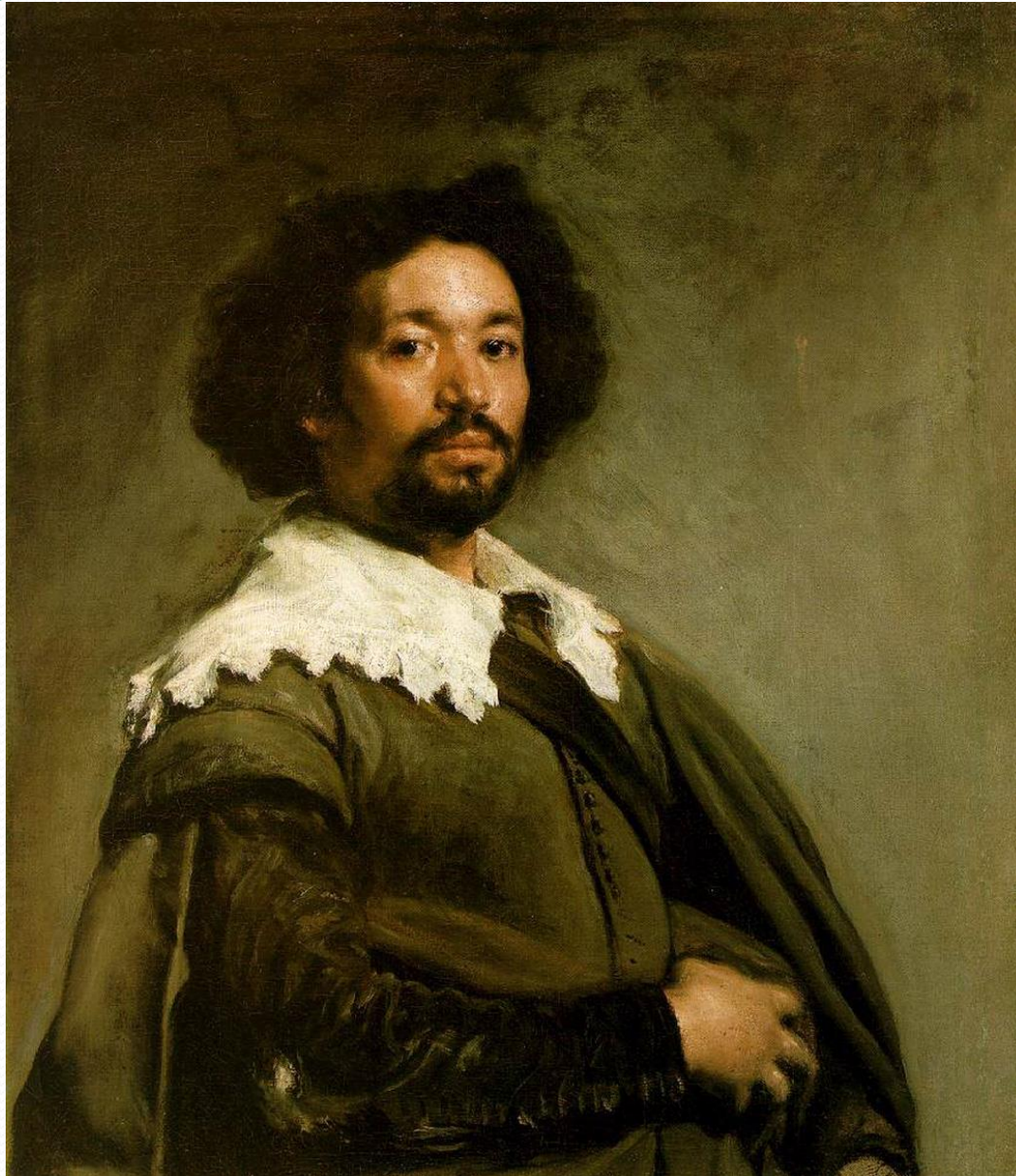
JUAN DE PAREJA