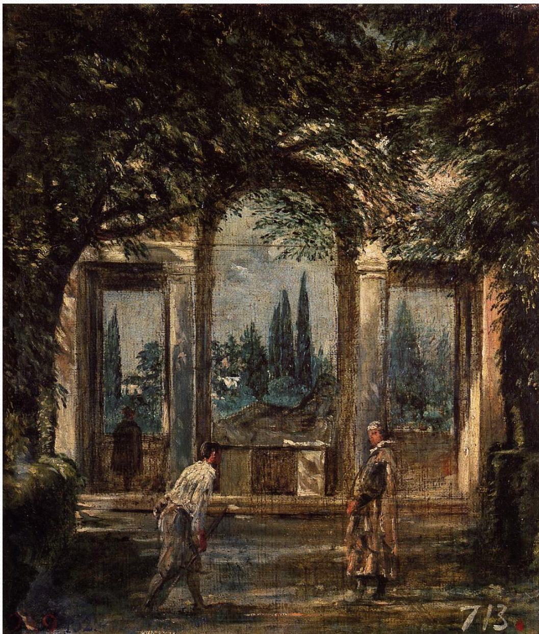
VISTA DE LA VILLA MEDICI