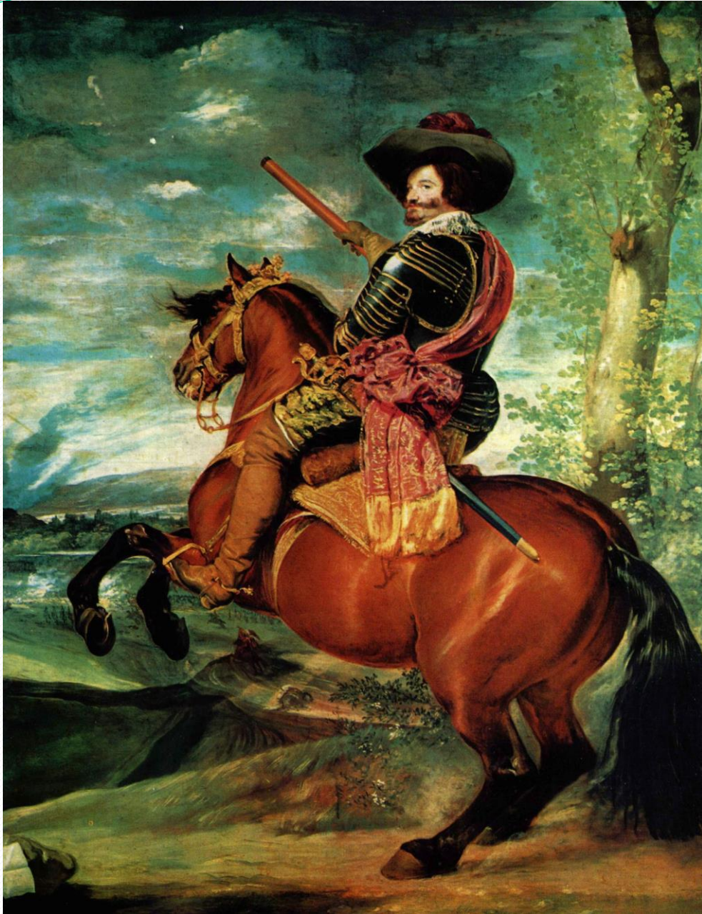
EL CONDE-DUQUE DE OLIVARES