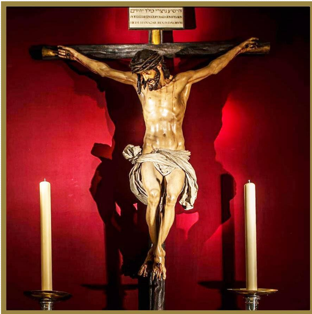
CRISTO DE LA CLEMENCIA